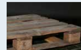
Keine vorgeschriebene Kennzeichnung mehr lesbar