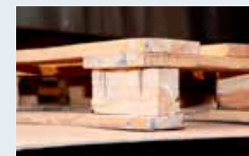
Sichtbare Befestigungselemente z.B. Nägel