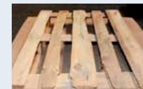
Unzulässiges Bauteil, z.B. untermäßig, morsch, Baumkante