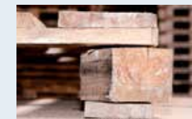
Verdrehter Klotz > ca. 1cm