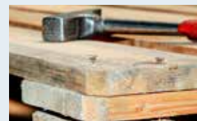
Einschlagen herausstehender Befestigungselemente