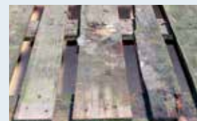
Trocknung/Reinigung durchnässter Bretter