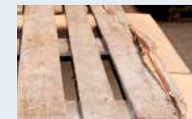
Quer-, an- oder durchgebrochenes Brett